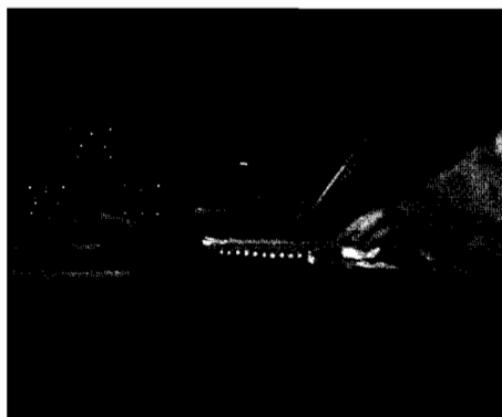
Abb. 2 & 3: Johannes Vermeer: Briefschreiberin in Gelb (Details), Öl auf Leinwand, 45 x 39,9 cm, ca. 1665-70, Washington, National Gallery of Art.