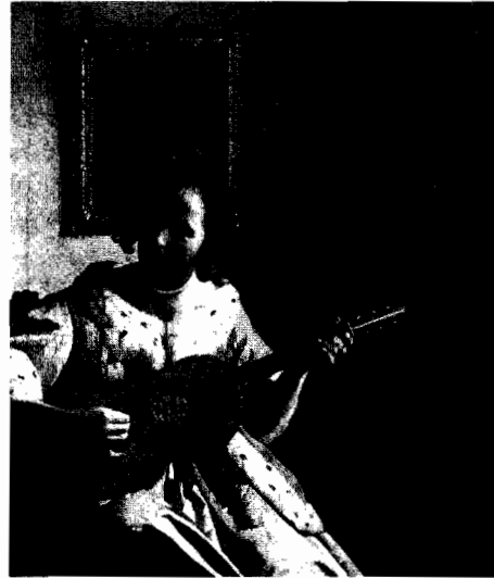
Abb. 4: Johannes Vermeer: Die Gitarrenspielerin, Öl auf Leinwand, 53 x 46,3 cm, ca. 1672, Kenwood, The Iveagh Bequest.

undeutlichen, aber fett leuchtenden Glanzfleck auf einem Glasrand, der uns aus der Tiefe des Dunkels anblitzt, anblickt (Abb. 3).