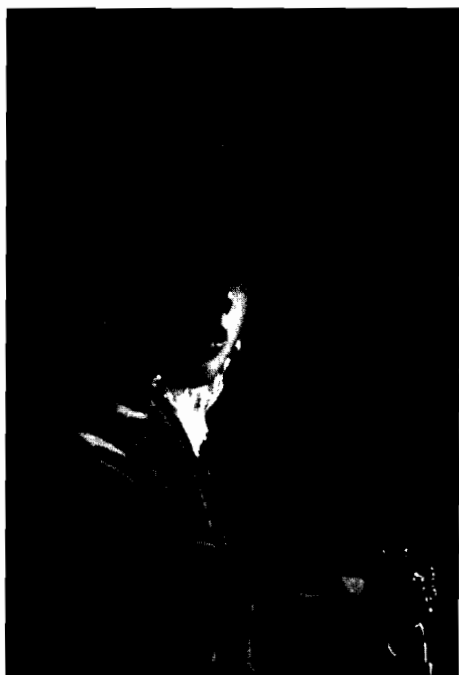
Abb. 5: Johannes Vermeer: Mädchen mit rotem Hut, Öl auf Holz, 22,8 x 18 cm, ca. 1665-67, Washington, National Gallery of Art.

wohlkalkulierte, farblich nuancierte Auszeichnung der Augen steht in einer dynamischen, räumlich kaum auslotbaren Spannung zu den Glanzreflexen auf Ohrgehänge, den Lippen und der Nase. Dieses subtile Spiel der Glanz- und Lichtwerte im Bereich des Gesichts der jungen Frau wird – wie im Bild der jungen Frau mit Gitarre – von einer Reihe von Lichteffekten getragen, die sich auf einer anderen Bildebene zu bewegen scheinen: Die moiréartigen Reflexe, mit denen das Licht auf dem Faltenwurf des blauen Umhangs spielt, die ›Spritzer‹ weißer Farbe auf dem roten Hut, wie auch das gleißende Licht des Foulards, das unter dem Kinn der jungen Frau hervorschießt, sind allesamt unscharf und in verschwommener Malweise wiedergegeben. Die Wirkung, die diese kunstvolle Unschärfe auf den Betrachter besitzt, gelangt hier besonders deutlich zum Ausdruck: Das Bemühen, die leuchtenden Flecken scharf und damit ruhig zu stellen, d.h. sie in den Rahmen eines realistisch gedeuteten sujets zu integrieren, scheitert notgedrungen und erzeugt eine stete Quelle der visuellen Erregung.